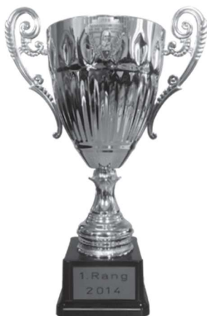
Grosser Rothenthurmer Becher 300m